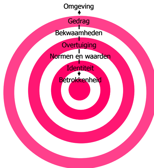
Figuur 2. Het Ui-model van Korthagen

De huidige invoering en discussie over competentiegericht beroepsonderwijs gaat volgens mij te veel voorbij aan dit wezenlijke vraagstuk als het gaat om beroepsvorming tot vakmanschap. De discussie beperkt zich te veel tot de buitenkant van de persoon. Korthagen (2004) wijst erop dat het gevaar groot is dat tot in den treuren wordt uitgewerkt aan welke kennis en kunde deelnemers aan het beroepsonderwijs moeten voldoen. Bovendien is volgens hem de kans groot dat men hierbij verzandt in telefoonboeken vol specificaties van